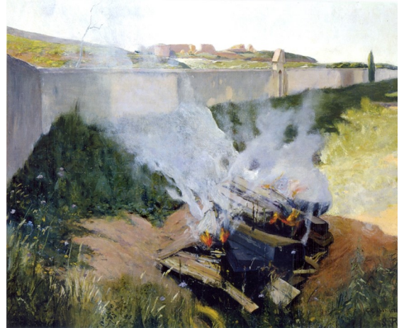
Pulvis, cineris, nihil 1894 oli sobre tela 97x136 cm Col·lecció crèdit Andorra

[...] Ja post el sol, ens aixecàvem i caminàvem costa amunt per veure sobre el mar les relliscades de la llum i els tremolors del cel, i per aplaudir la lluna que sortia grossa i encesa del llit de les onades; un tros de plana acotxant-se a poc a poc, sota la boira, abans de quedar adormida. Quins moments foren aquells! [...] i Quin món d'idees ens despertava aquella comunió gaudida pausada i íntimament amb la gran Naturalesa! L'Yxart [...] no volent sentir la mort que s'apropava, ens explicava els seus projectes, [...] Als pocs dies vaig anar a París i Yxart va escriure'm.