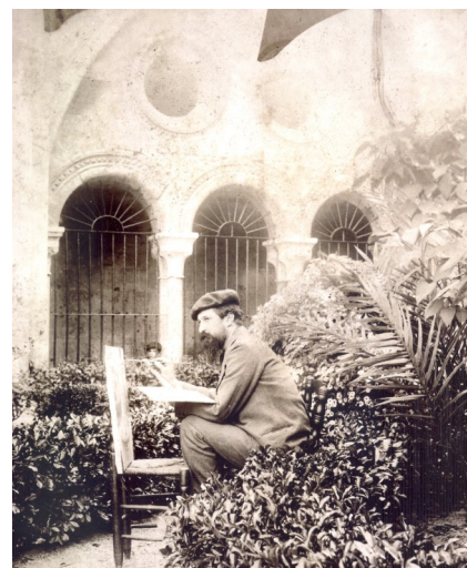
Rusiñol al claustre de Tarragona 1897