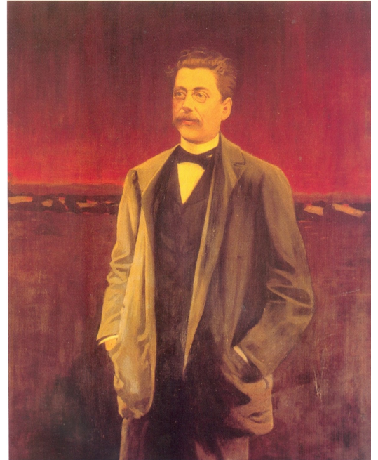
Josep Ixart pintat per Santiago Rusiñol 1897 Oli sobre tela 140x100 cm.

Xart, Josep. "Teatre català. Ensaig teòric crític". A: Entorn de la literatura catalana de la Restauració . Barcelona : Edicions 62, 1980. p. 40-41.