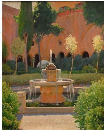
La gran font del claustre 1897 oli sobre tela. Museu de Montserrat

Al cim del campanar amorosit pels raigs del sol ponent, s'hi sentia solemne, majestuós, el toc pausat de la Capona; els ocells cantaven alegres tot buscant en les branques un lloc on ajocar-se per a passar-hi la nit; i una calma, una quietud imponent, regnava en aquella hora en tots els àmbits del jardí.