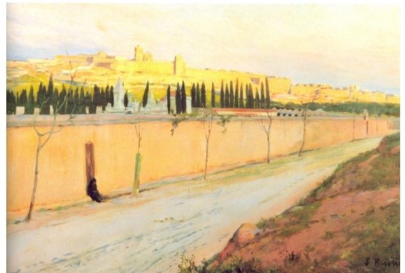
Camí del cementiri. 1894 oli sobre tela 77x116 cm Col·lecció particular