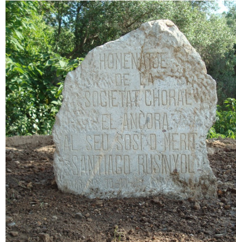
Pedró en homenatge Santiago Rusiñol. Societat Coral L'Ancora .1928

En la seva obra de pintor i d'home de teatre hi ha una part mediocre; però les obres excel·lents no són escasses, i n'hi ha algunes d'exceptacionals que li donen ple dret a la glòria. En morir Russinyol, tota la seva llarga vida, plena de treball i de facècies, es fa present en la memòria dels catalans, que ploraren la desaparició d'aquest patriarca de la nostra terra, resum d'una època i símbol d'un sector del nostre poble, d'aquest català que ha viscut pintant i escrivint i ha mort respirant l'aroma dels jardins llunyants que l'havien encisat.