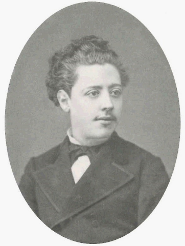
Josep Yxart i de Moragas (Tarragona, 1852–1895), c. 1873