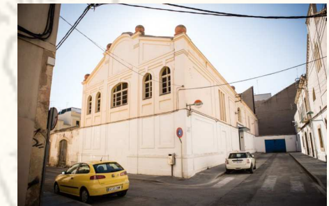
Part Baixa . 23 novembre.

Biblioteca Pública de Tarragona , Fortuny, 30, 43001 Tarragona Telèfons. Informació: 977 240 331, 977 240 544, 977 248 304 bptarragona.cultura@gencat.cat