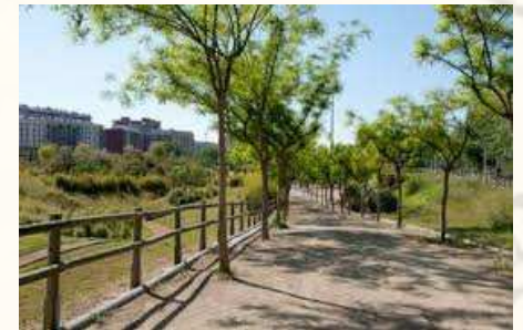
Parc del Francolí. 3 novembre.