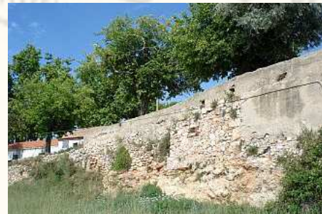
L'Oliva. 19 octubre.