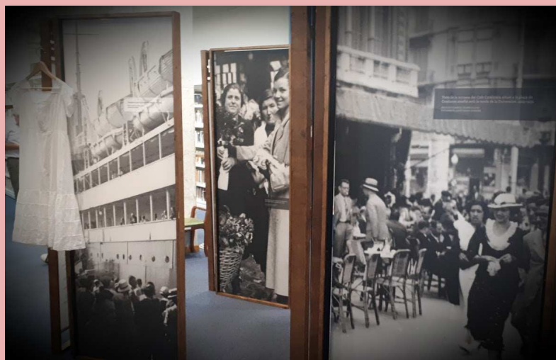
Fotografies de l'exposició "Aloma, de Mercè Rodoreda" a la Biblioteca.