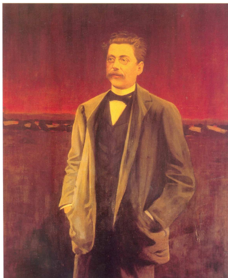
Retrat de Josep Yxart pintat per Santiago Rusiñol. Galeria de Tarragonins il·lustres